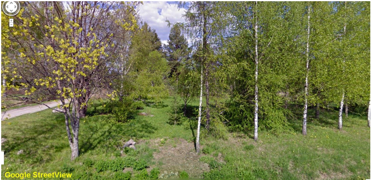
Vanhalta Tamperentieltä erkaneva tonttitie, pohjois-koilliseen.