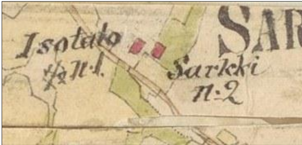
Ote kartasta 1840l