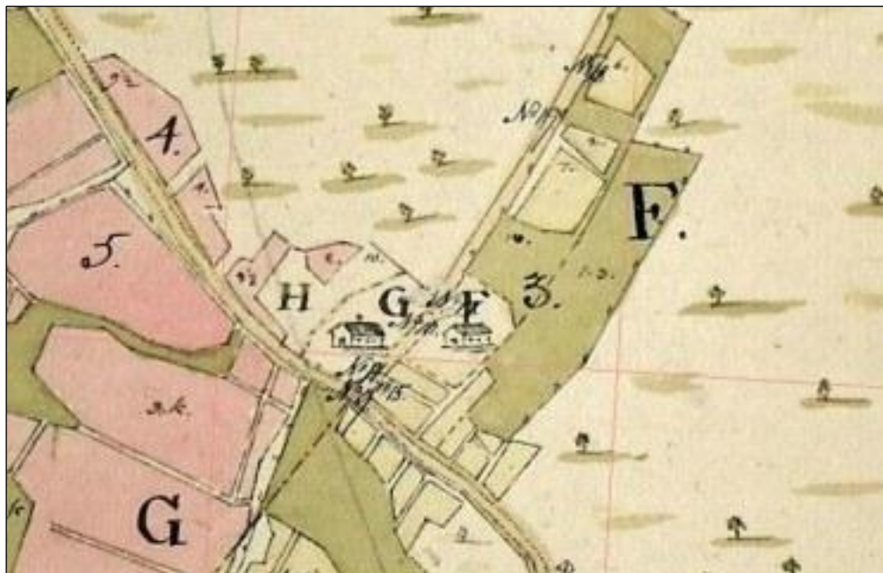
Ote kartasta 1799